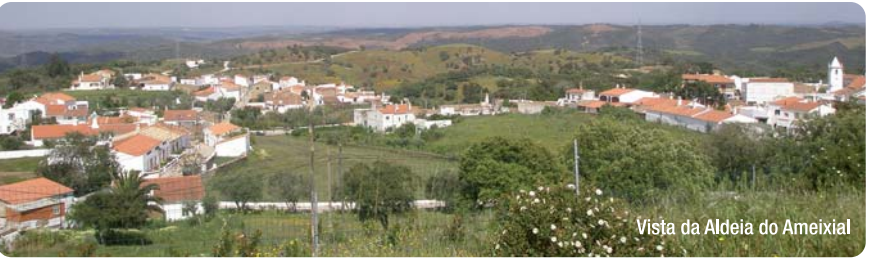
Visita da Aldeia do Ameixial

Opção longa — do cruzamento na estrada de acesso ao campo de futebol, o caminhante vira à esquerda e dirige-se em direcção ao mesmo. A Nascente, o caminhante encontra um trilho que o leva para Sudoeste, na direcção do vale e da Ribeira do Vascãozinho. Este trilho atravessa uma zona florestal de eucaliptos, desce para uma linha de água — descida curta mas íngreme — cruza-a e sobe até chegar a um caminho mais largo que o liga, por sua vez, à principal estrada de acesso à Corte de Ouro (nº 504). No cruzamento com esta estrada o caminhante regressa ao Ameixial e ao ponto de partida.