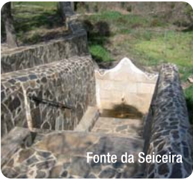
Fonte da Seiceira