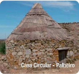
Casa Circular - Palheiro