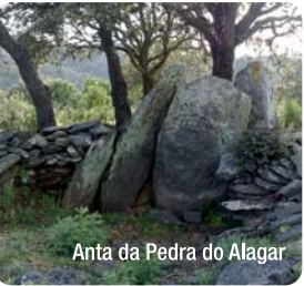
Anta da Pedra do Alagar

Antes de efectuar um percurso pedestre ou outro convém seguir os seguintes conselhos: