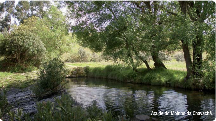
Açude do Moinho da Chavachã