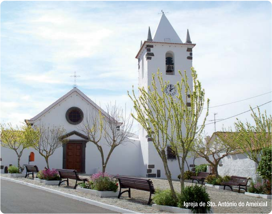
Igreja de Sto. António do Ameixial